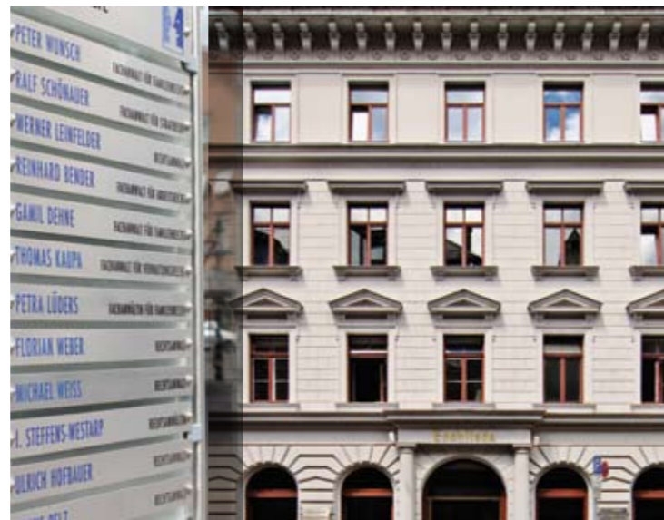
Gestaltung: Liquid.ag | Text: Presse- und mehr.de

Allgemeines Zivilrecht / Wirtschaftsmediation Arbeitsrecht / Betriebsverfassung Bank- und Kapitalanlagerecht EDV-Recht Erbrecht / Testament / Unternehmensnachfolge Familienrecht Gewerblicher Rechtsschutz / Wettbewerbsrecht Handels- und Gesellschaftsrecht Insolvenzrecht / Schuldenbereinigung Medizin- und Arztrecht Miet-, Pacht- und WEG-Recht Sozialrecht Steuer- und Zollrecht Strafrecht / Steuerstrafrecht Verkehrsrecht Vertragsrecht Verwaltungsrecht